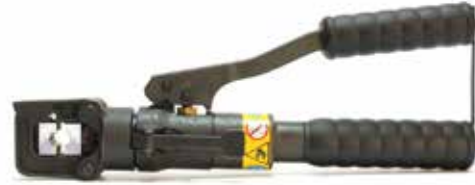
Manual Hydraulic Crimping Tool 5 MM with dies