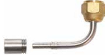
1/4" 90° Paslanmaz Presli Tip 1/4" 90° Angle Fittings