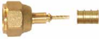
1/4" Presli Tip Rakor 1/4" Straight Fittings