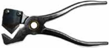
Tube Cutter R57010 890/25