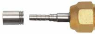
3/8" Düz Paslanmaz Presli Tip 3/8" Straight Fittings