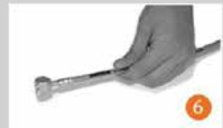
İşlem tamamlanmıştır. The assembling process is finished.