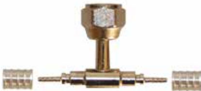
1/4" TEE Üstten Rakorlu 1/4" TEE SWS 2 Hoses Connections * 1/4 Nut in Middle