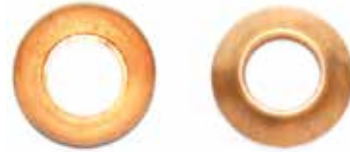
Copper Gasket 1/4"