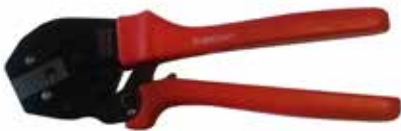
Crimping Tool 2 mm RUBICON