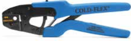
Crimping Tool 2 MM