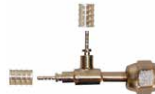
1/4" TEE Yandan Rakorlu 1/4" TEE SWS 2 Hoses Connections* 1/4 Nut on the side