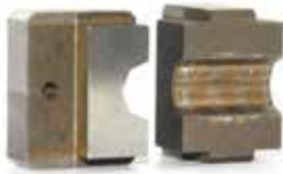
Die for Crimping Tool