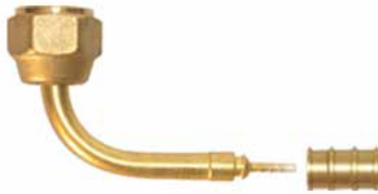
1/4" Presli Tip Rakor 90° 1/4" 90° Angle Fittings