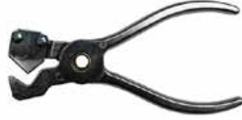
Tube Cutter R57000 890/12