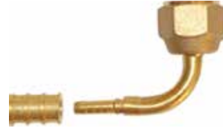
1/4" 90° Düz Piriç Presli Tip 1/4" 90° Angle Fittings