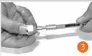
Cold-Flex aparatını hortamın iç kısmına takın. Connect to Cold-Flex fittings into the hose.