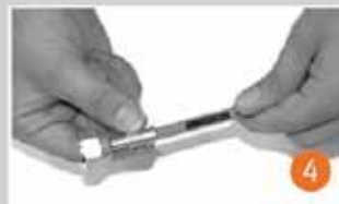
Aparatın tam olarak yerleştiğinden emin olan Maka sure to insert to fittings entirely and tightly fitted.