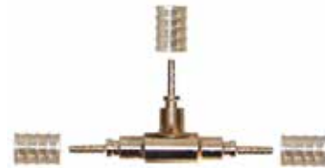
1/4" TEE Dişi-Dişi-Dişi Rakorsuz 1/4" TEE SSS 3 Hose Connection