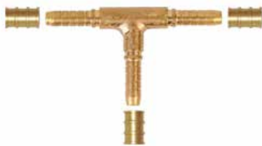
TEE Piriç Presli Tip TEE