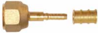
3/8" Düz Piriç Presli Tip 3/8" Straight Fittings