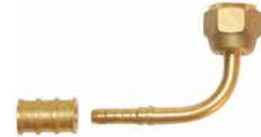
3/8" 90° Piriç Presli Tip 3/8" 90° Angle Fittings