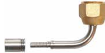
3/8" 90° Paslanmaz Presli Tip 3/8" 90° Angle Fittings