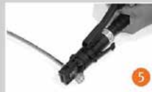
Sıkma pensesi otomatik atıncaya kadar sıkma işlemine devam edin. Crimp the sleeve with Cold-Flex crimping tool until the pliers automatically click